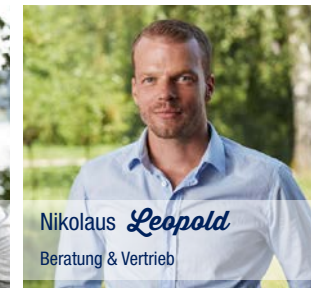
Nikolaus Leopold Beratung & Vertrieb